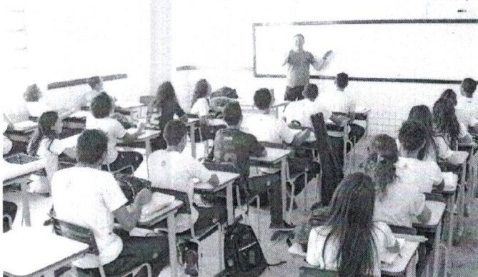
Seduc registra crescimento do Ideb no Maranhão

O Ideb do Maranhão tem mostrado crescimento significativo desde 2015, do ensino fundamental ao ensino médio. Nos anos iniciais, partindo de 4,4 em 2015, o índice passou para 4,5 em 2017, subindo para 4,8 em 2019. Mesmo em 2021, um período fortemente impactado pela pandemia, o indicador se manteve praticamente estável em 4,7, para então atingir o impressionante patamar de 5,1 em 2023. Esse avanço demonstra não apenas a resiliência do sistema educacional maranhense frente às adversidades, mas também a eficácia das políticas públicas adotadas para o ensino básico fundamental. Já nos anos finais do ensino fundamental, o crescimento também é notório. Em 2015, o Ideb era de 3,7, mantendo-se nesse patamar em 2017. No entanto, a partir de 2019, com o índice subindo para 4,0, e posteriormente para 4,2 em 2021, observa-se uma tendência clara de evolução, culminando nos 4,3 alcançados em 2023. Este aumento, ainda que em ritmo mais gradual, reflete um esforço constante para elevar a qualidade do ensino e garantir que os alunos do Maranhão estejam cada vez mais preparados para os desafios futuros, chegando ao ensino médio com uma bagagem de conhecimentos sólida. Para o secretário de Educação em exercício Anderson Lindoso, a comemoração do estado vai além dos dados divulgados. "Os resultados do Índice de Desenvolvimento da Educação Básica de 2023 trazem notícias promissoras para a educação no Maranhão. Essa trajetória de crescimento contínuo