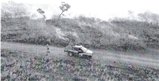
Operação Maranhão Sem Queimadas intensifica atividades

Os incêndios e queimadas têm expressivo crescimento no período de estiagem, tanto na área rural, quanto urbana. Os fortes ventos, calor intenso e a escassez de chuvas provocam aumento da temperatura, ocasionando focos de fogo. No primeiro semestre deste ano, foram contabilizadas 3.564 ações para combate e prevenção destas ocorrências. Os dados são do Corpo de Bombeiros Militar do Maranhão (CBMMA), resultado da operação Maranhão Sem Queimadas – Protetores do Bioma, reforçada este semestre e que prossegue até dezembro.