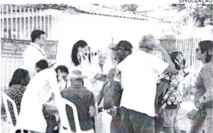
Ação social do MPMA garantiu atendimento à população em situação de rua

O Ministério Público do Maranhão, por meio da Promotoria de Justiça Distrital da Cidadania do Centro, realizou, na manhã dessa segunda-feira (19), uma mobilização para atendimento da população em situação de rua, na Praça D. João José, em São Luís. O objetivo da iniciativa foi destacar os direitos dessa população, oferecer serviços e promover discussões para expandir a implementação de políticas públicas eficazes para pessoas em situação de rua. Na ocasião, estavam sendo disponibilizados serviços como exame de sangue, aferição de pressão arterial, além de cadastro para a obtenção de