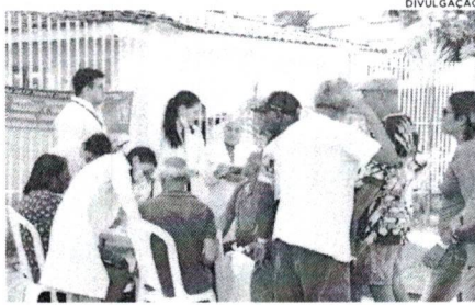
Ação social do MPMA garantiu atendimento a população em situação de rua

O Ministério Público do Maranhão, por meio da Promotoria de Justiça Distrital da Cidadania do Centro, realizou, na manhã dessa segunda-feira (19), uma mobilização para atendimento da população em situação de rua, na Praça da Sé, em São Luís. O objetivo da iniciativa foi destacar os direitos dessa população, oferecer serviços e promover discussões para expandir a implementação de políticas públicas eficazes para pessoas em situação de rua. Na ocasião, estavam sendo disponibilizados serviços como exame de sangue, aferição de pressão arterial, além de cadastro para a obtenção de