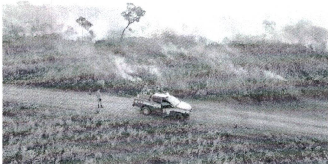
Operação Maranhão Sem Queimadas intensifica atividades

Os incêndios e queimadas têm expressivo crescimento no período de estiagem, tanto na área rural, quanto urbana. Os fortes ventos, calor intenso e a escassez de chuvas provocam aumento da temperatura, ocasionando focos de fogo. No primeiro semestre deste ano, foram contabilizadas 3.564 ações para combate e prevenção destas ocorrências. Os dados são do Corpo de Bombeiros Militar do Maranhão (CBMMA), resultado da operação Maranhão Sem Queimadas – Protetores do Bioma, reforçada este semestre e que prossegue até dezembro.