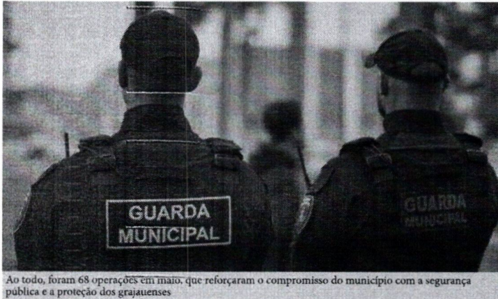
Ao todo, foram 68 operações em maio, que reforçaram o compromisso do município com a segurança pública e a proteção dos grajauenses