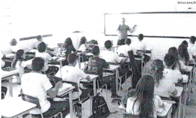
Seduc registra crescimento do Ideb no Maranhão

reflete o nosso compromisso com a melhoria da qualidade educacional, reforçado pelo regime de colaboração entre o governo do Estado, municípios e governo federal. É importante sublinhar que, embora o Estado tenha um papel de suporte, a responsabilidade direta pela educação no Ensino Fundamental e de competência da esfera municipal. O que significa que esta parceria, o Pacto pela Aprendizagem, firmado com os municípios, tem sido essencial para garantir avanços expressivos, demonstrando que o trabalho conjunto é o caminho para uma educação de qualidade para todos os maranhenses". Com esses números, o Maranhão demonstra que é possível superar desafios históricos na educação com planejamento, cooperação e foco na qualidade. O crescimento contínuo dos índices do Ideb, tanto nos anos iniciais quanto nos finais, revela que o estado está no caminho certo para oferecer uma educação cada vez melhor para suas crianças e adolescentes. O futuro da educação no Maranhão é promissor, e os resultados de 2023 são uma prova concreta desse compromisso.