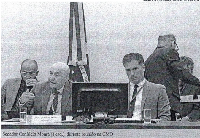
Senador Confúcio Moura (à esq.), durante reunião na CMO

que chegasse aqui a Lei Orçamentária do governo. Se você deixa para depois – para setembro, outubro, novembro ou fim do ano – a LDO não se justifica. Termina a Lei Orçamentária pegando corpo, velocidade e interesse dos parlamentares. No ano passado, houve uma exceção. Demorou porque não tinha o arcabouço fiscal [definido]. Mas, do jeito que está caminhando, não estou gostando. O que era para ser uma exceção, está virando uma regra”, lamentou. O Congresso Nacional aprovou