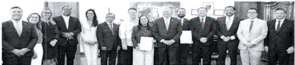
PARTICIPARAM DA SOLENIIDADE MAGISTRADOS, SERVIDORES E FAMILIARES